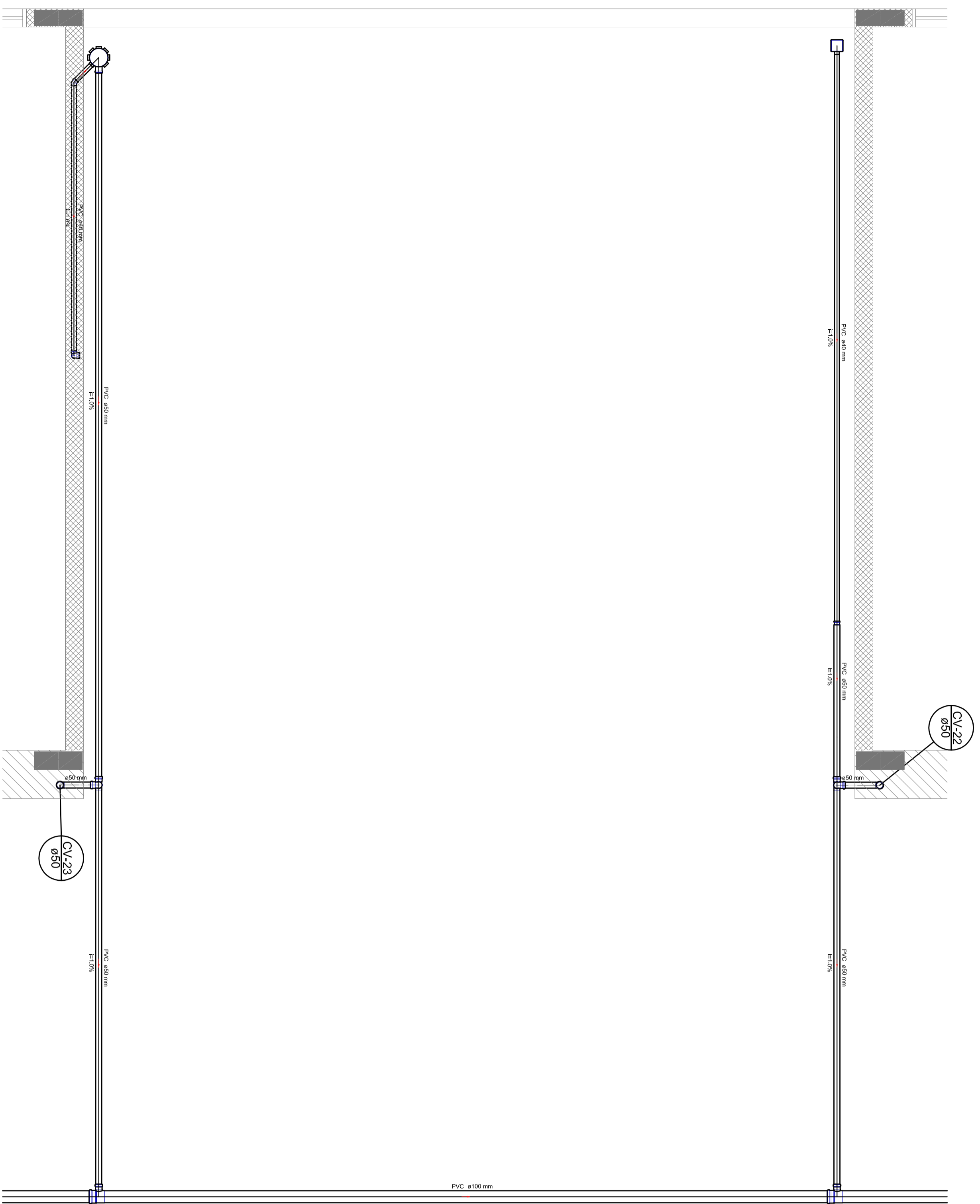
Detalhe S14 escala 1:25